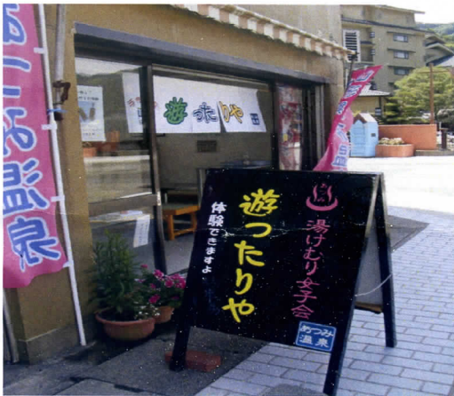
湯の里橋のたもとです

あつみの女性たちの元気な笑い声が今日もここに 있습니다 「よぐきたの～ まんず立ち寄って お茶飲んでいってけれの～・・・と」